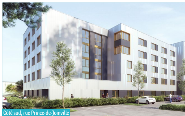
Côté sud, rue Prince-de-Joinville