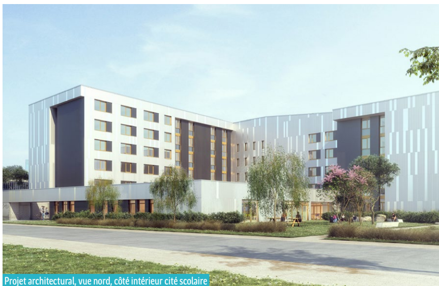
Projet architectural, vue nord, côté intérieur cité scolaire

D'une capacité de 140 chambres pour 544 internes, les nouveaux internats remplaceront les trois internats existants sur les trois sites lycéens, adjacents les uns aux autres. Ces infrastructures, datant des années 60, sont devenues inadaptées en termes de capacité, de qualité d'accueil et d'état bâtiminaire. L'opération s'inscrit plus largement dans un projet sur dix ans, un investissement régional de premier ordre pour la modernisation de la cité scolaire.